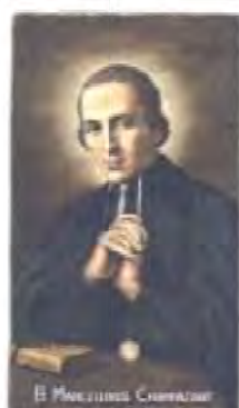
Il MARCELLINO CHAMPAGNAT