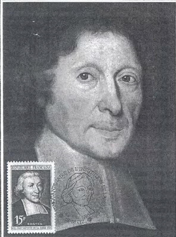
Cinquantenaire de l'INSTITUTION DE LA SALLE METZ, 3 - 4 - 5 juin 1988