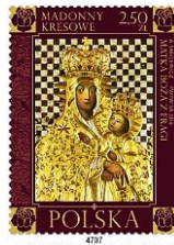
Madonna di Fraga (un villaggio ora in Ucraina)

Valore da 2,50 zł Madonna di Fraga (Ucraina)