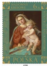
Madonna di pietra bianca (ora presso di Walbrzych)

Valore da 6 zł Madonna di pietra bianca di Walbrzych (Bassa Slesia)