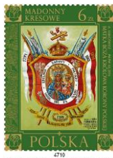
Madonna del Regno di Polonia (Lewacze vicino Volen)

Valore da 6 zł Madonna Regina del Regno di Polonia (Lewacze)