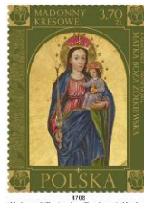
Madonna di Zhovkra (un villaggio ora in Ucraina)

Valore da 3,70 zł Madonna di Zhovkra (Ucraina)