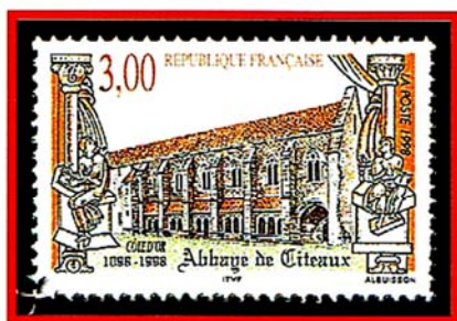
Abbazia cistercense di Cîteaux

Dall'XI secolo in poi confraternite, Corporazioni ma soprattutto Ordini religiosi tra cui Benedettini, Cistercensi, Gesuiti, Domenicani, Certosini, Francescani, fecero a gara ad innalzare chiese, altari, abbazie in nome di Maria ed a dedicarLe piazze, strade, villaggi, poderi.