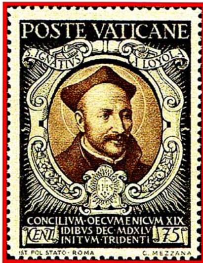
Ordine dei Gesuiti

I Domenicani, entrati in Lussemburgo nel 1292, introdussero il Rosario.