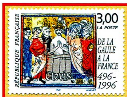
S. Remigio di Reims (battezza Clodoveo)

Già intorno alla metà dell'anno 300 tramite vescovi celebri tra cui Massimino e Paolino di Treviri, Remigio di Reims, San Servizio, le popolazioni locali