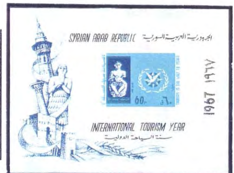
La popolazione degli odierni siriani si fanno risalire all'antico popolo dei Chititei o Ittiti