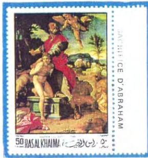
Il Sacrificio di Abramo Andrea Del Sarto

12 <<Non metter la mano addosso al ragazzo....ho constatato che sei temente di D.o....>>