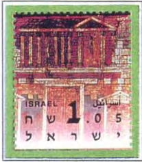
Monte Morijà, dove re Salomone edificò il Santuario. Il primo tempio è il tempio di Salomone da un dipinto murale della Sinagoga di Duna Europos

²<< Prendi – gli disse – il tuo amato unico figlio, Isacco, va alla terra di Morijà e là offrilo in olocausto su uno dei monti che ti dirò >>