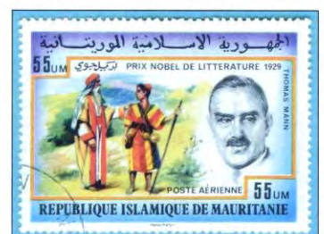
Opera letteraria di T. Mann: Abramo ed Ismaele