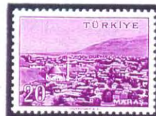
Afyon e Maras sono antiche città Ittite oggi turche