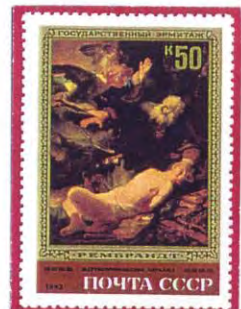
Il sacrificio di Abramo di F. Benkovic Il Sacrificio di Isacco di Rembrandt