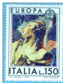
L'angelo appare ad Agar - dal quadro di G.B.Tiepolo

15 Hagar partorì ad Abramo un figlio al quale egli pose nome Ishma'el (= D.o ascolta)