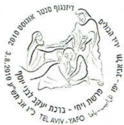
Berachà - Benedizione (di Giacobbe ai figli di Giuseppe - Genesi p. Vaichi)

La 'Creazione' è associata al 'dualismo', dicono i Saggi: tutto è <due> infatti vi è: la Torah scritta e la Torah orale, Mosè e Aronne, Cieli e Terra, Sole e Luna, maschio e femmina, ecc. meno l'Unico, l'Altissimo.