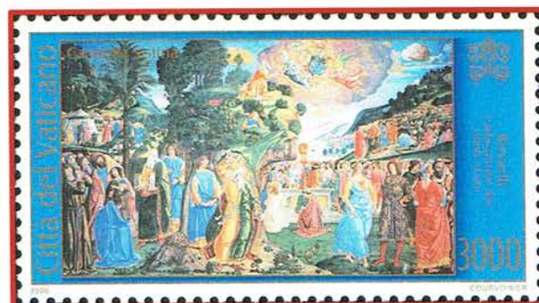
Cappella Sistina <Adorazione del vitello d'oro>

Il verbo 'pentirsi' risuona anche (Es.32:12) come <revoca> al fine di fare del bene invece del male come quando Mosè intercede per il popolo che ha peccato costruendosi il vitello d'oro con queste parole: <Trattieni dunque l'accesso Tuo sdegno e revoca la condanna minacciata...>