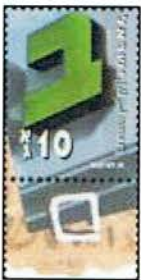
Lettera BETH - Seconda dell'alfabeto

'Barà' è il primo verbo nella Bibbia ebraica ed è riferito esclusivamente al Signore, la Sua prima azione: questo 'creare' sarà un verbo mai applicato all'uomo, nella lingua ebraica.