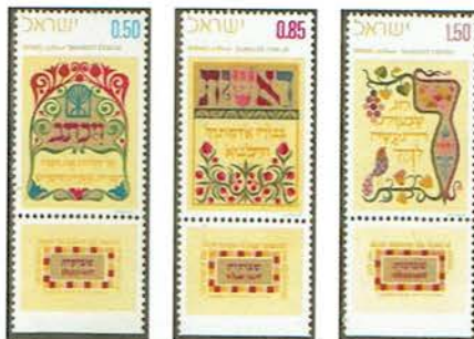
Festa di Shavuot che commemora la rivelazione sul Monte Sinai

Questi Dieci Comandamenti sono la guida del popolo ebraico ed hanno ispirato, successivamente, il Cristianesimo attraverso i Vangeli ed il messaggio degli Apostoli, poi l'Islam ed infine in epoca moderna con i 'Diritti dell'uomo' la morale laica comune della nostra società.