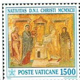
(Gen. 15 e 17)

<...parola del Signore...> (Gen. 22:16) con questa promessa viene ribadito il Patto di Alleanza già espresso dal Signore ad Abramo