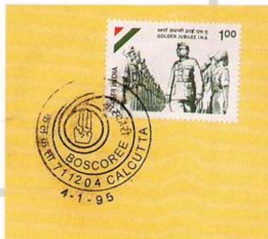
A. 4.1.95 CALCUTTA VI National Boscoree.