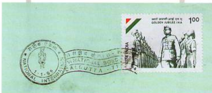
A. 1.1.95 CALCUTTA VI National Boscoree.