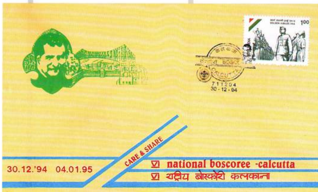
A. 30.12.94 CALCUTTA VI National Boscoree.