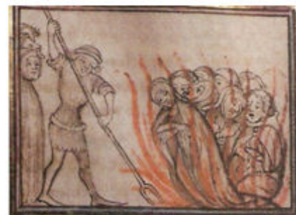
(<Il rogo dei Templari> miniatura del XIV secolo)