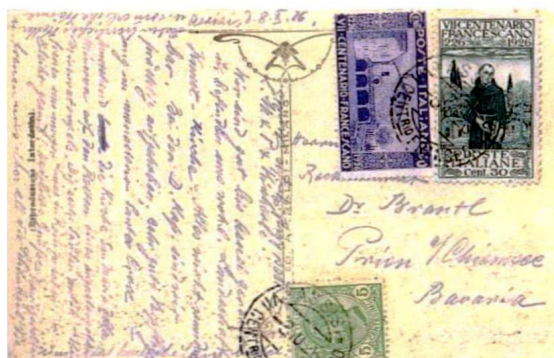
1926 annullo speciale