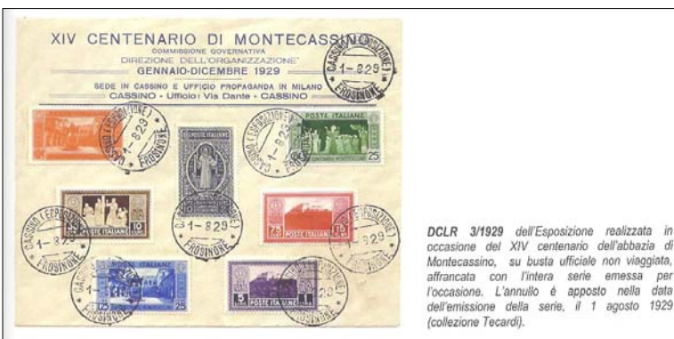
DCLR 3/1929 dell'Esposizione realizzata in occasione del XIV centenario dell'abbazia di Montecassino, su busta ufficiale non viaggiata, affrancata con l'intera serie emessa per l'occasione. L'annullo è apposto nella data dell'emissione della serie, il 1 agosto 1929 (collezione Tecardi).