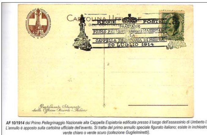
AF 10/1914 del Primo Pellegrinaggio Nazionale alla Cappella Espiatoria edificata presso il luogo dell'assassinio di Umberto I. L'annullo è apposto sulla cartolina ufficiale dell'evento. Si tratta del primo annullo speciale figurato italiano; esiste in inchiostro verde chiaro o verde scuro (collezione Guglielminetti).

Inoltre la pubblicazione avrebbe una mole (ed un costo!) non giustificabile con il presumibile numero delle copie vendibili. Dobbiamo accontentarci