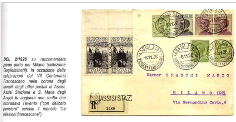
DCL 2/1926 su raccomandata primo porto per Milano (collezione Guglielminetti). In occasione delle celebrazioni del VII Centenario Francese nella corona degli annulli degli uffici postali di Assisi, Assisi Stazione e S. Maria degli Angeli fu aggiunta una scritta che ricordava l'evento ("con delicato pensiero" scrisse il mensile "Le missioni francescane").