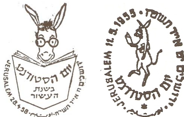
(Israele - Giornata degli studenti)

E' noto come l' asino sia stato oggetto di culto o mezzo di sacrificio nell'antichità classica dell'oriente e africana. Un largo posto l'occupò anche nel folklore, nell'arte e nella letteratura di molti paesi europei ed extraeuropei. L' adorazione dell' asino da parte degli antichi Romani è d'incerto significato dando tuttavia vita ad una letteratura frammentaria e discorde sull' onolatria