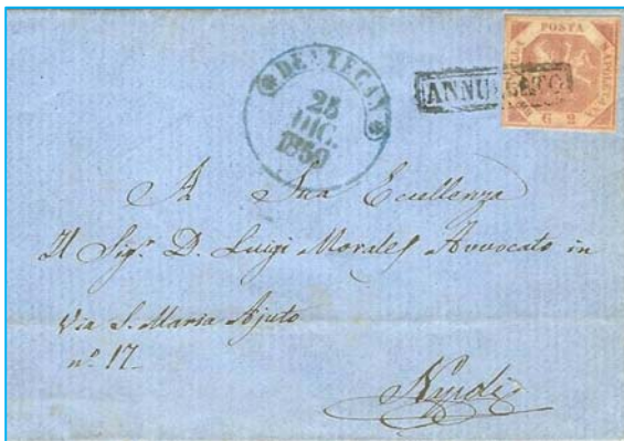
Regno di Napoli: lettera con annullo del 25.12.1855