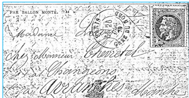
Corrispondenza trasportata con il Ballons Montés "Le Tourville" il 25.12.1870