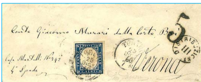
Regno di Sardegna: da Torino a Verona 25.12.1860