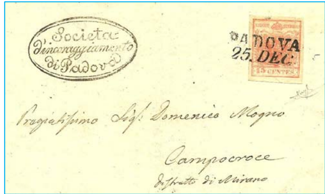
Lombardo Veneto: lettera spedita da Padova a Campocroce con annullo 25.12.1851