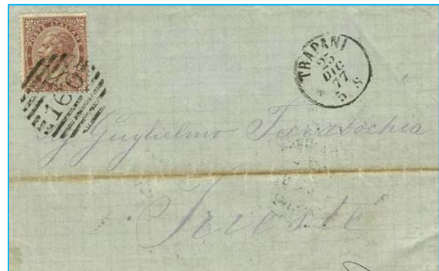
Regno d'Italia: lettera spedita da Trapani a Trieste Con annullo 25.12.1877