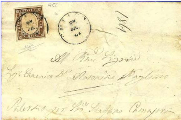
Stati Sardi: lettera da Siccia a Palermo Spedita il giorno di Natale del 1861

Nel secolo scorso e nei primi anni di questo secolo, gli Uffici Postali annullavano la corrispondenza anche il giorno di Natale! Lo confermano numerose buste che recano il timbro "25 dicembre", di cui alcune vengono riprodotte. Con le nuove poste e con gli orari moderni... (sarà una ripassata su quanto i loro vecchi colleghi lavoravano...!)