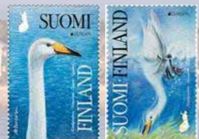
(ill. da 36 a 38)