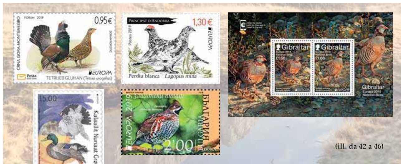
(ill. da 42 a 46)