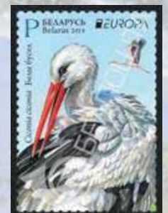
(ill. da 27 a 31)