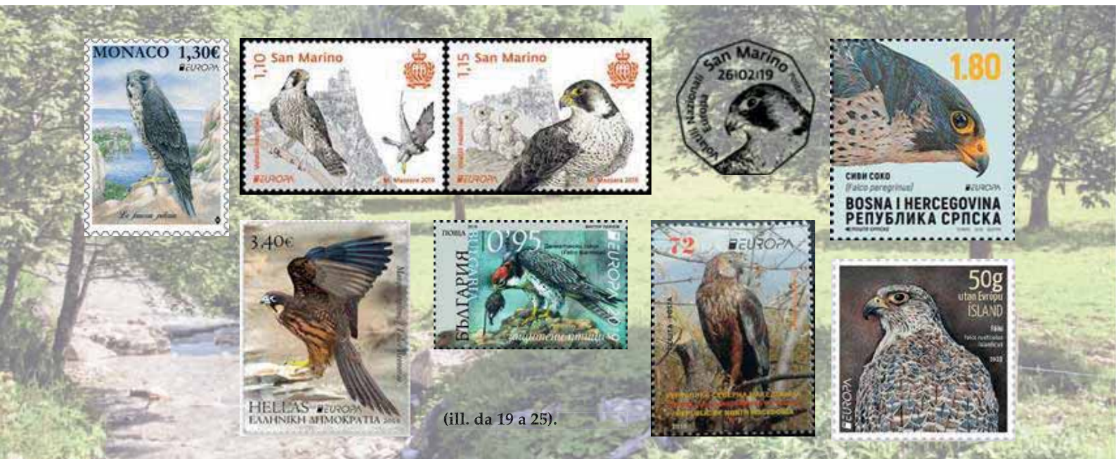
(ill. da 19 a 25).

Le seguenti Nazioni hanno prescelto di reclamizzare il Falco peregrinus – Falco pellegrino – le Poste di Monaco (ill.19), le Poste di San Marino (ill.20 a-b-c), le Poste della Bosnia serba (ill.21), mentre le Poste della Grecia presentano il Falco eleonorae (ill.22) – Falco della Regina ( Eleonora di Aquitania che nel XIV secolo emise Leggi per vietare la caccia ai falchi adulti e il prelievo dei piccoli dai nidi), le Poste della Bulgaria il Falco biarmicus (ill.23) – il Lanario , le Poste della Macedonia del nord il Circus aeruginosus – il Falco della Palude (ill.24), le Poste d’Islanda il Falco rusticolus islandicus . (ill. 25)