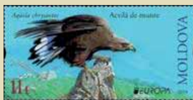
(ill. da 6 a 10).