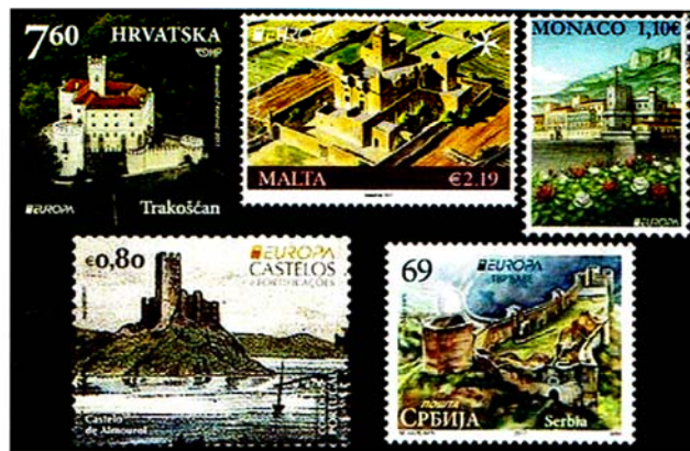
(In alto a dx il Castello Grimaldi a Monaco)

Il nostro viaggio immaginario (o vademecum per le vostre vacanze estive 2017 se deciderete di girare un po' di Europa) partirà dall'Isola più vicina a noi dove la Poste di Malta evidenziano le bellezze di due suoi Castelli , di cui parleremo dettagliatamente in seguito.