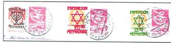
Corrispondenza da Birobidjan