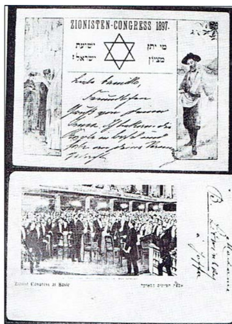
Cartoline ufficiali del I Congresso Sionista – Basilea

Ebbe successo in entrambi i campi: dei suoi figli: uno diverrà un pittore di successo ed una scrittrice famosa e a sua volta sarà madre di una figlia autrice di best seller; intanto con i suoi successi letterari e l'agiatezza che derivò anche a seguito della morte del suocero (1885) che lo rese anche capo della famiglia , incoraggiò ed aiutò altri scrittori finché, per speculazioni sbagliate, perse tutto il suo patrimonio (1890).