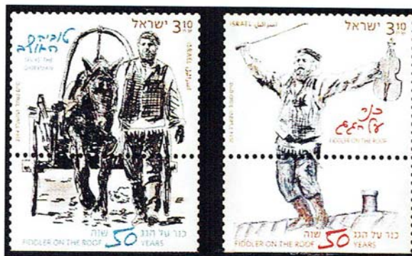
L'eroe di quest'opera, il lattai Tewje, ha un amore totale per il Signore con il quale colloquia continuamente. Lo scritto è pieno di metafore che si esprimono fin dall'inizio con il <violinista sul tetto>

Cosa che avviene ancora oggi e non solo per la cerchia ristretta delle persone da lui citate ma anche per il pubblico.