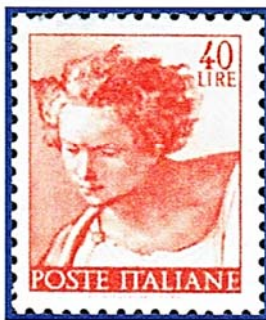
Il profeta Daniele

Gli Ebrei credono nella venuta del Messia e parallelamente nella Risurrezione dei morti secondo quanto detto dal profeta Ezechiele, per quanto si legge nella 'Preghiera di Channà' < Il Signore è quello che fa morire e fa risorgere, fa discendere nella tomba e ne fa risalire! > (1 Sam.2:6), conformemente alla visione del profeta Daniele (12:2) < Molti di quelli che dormono nella polvere delle terra si desteranno.... >, in base alla profezia di Isaia (58:11) < ...e farà rinvigorire le tue ossa, e sarai come un giardino irrigato,... >