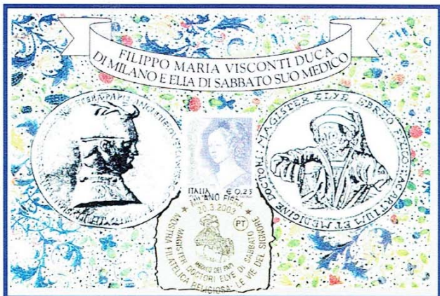
Elia di Sabbato – medico anche di Filippo Maria Visconti (Maximum della nostra manifestazione milanese del 2003- Sono ancora disponibili alcuni pezzi)

Nei tempi antichi, quando un Ebreo – ma in seguito, anche Papi e regnanti – si ammalava poteva ricorrere ai migliori medici del mondo per curarsi: i medici correligionari.