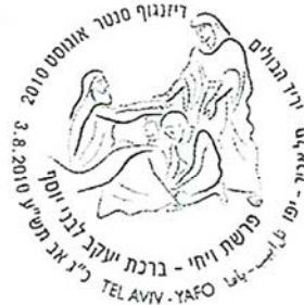
GENESI - Par. VAICHI'

decesso, il parente più prossimo gli chiude gentilmente occhi e bocca e pone lungo il corpo braccia e mani; il corpo viene adagiato a terra, coperto con un lenzuolo, con i piedi rivolti verso la porta; una candela è accesa in prossimità della testa del defunto e tutti gli specchi sono girati verso il muro o coperti con drappi.