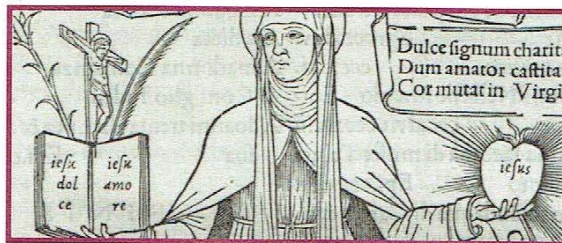
Il primo tentativo di corsivo sperimentato da Francesco Griffo in una illustrazione alle "Epistole" di Santa Caterina: <Jesu dolce amore>

Manuzio si avvale (o si appropriò ?) dell'opera del bolognese Francesco Griffo famoso per aver realizzato i punzoni dei caratteri tipografici italici ovvero del corsivo che per molto tempo vennero chiamati erroneamente, aldini , e vi realizzò nel 1501 l' "Eneide" di Virgilio.