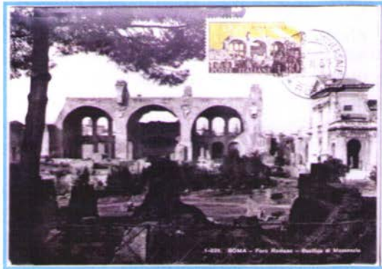
Roma – Basilica di Massenzio

Occidente ma i primi tre si coalizzarono contro quest'ultimo che era riuscito ad ampliare le sue conquiste e possedeva, ormai, Italia e Africa, il prestigioso centro dell'Impero.