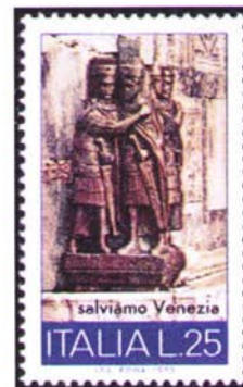
I primi Tetrarchi

Il sistema di questa prima "Tetrarchia" si rivelò effettivamente efficace e durò oltre vent'anni ma purtroppo non teneva conto delle successioni; infatti già con l'abdicazione di Diocleziano e Massimiano iniziarono i primi contrasti poi, con la morte di Costanzo Cloro, il sistema entrò in crisi e tutti gli equilibri interni si dissolsero.