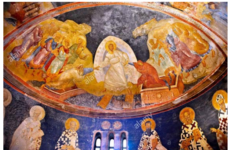
L'affresco della Resurrezione (Anastasis) all'interno di San Salvatore in Chora (XIV secolo).