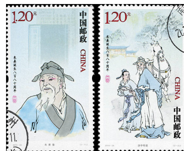
Zhu Xi (1130-1200 d.C.)