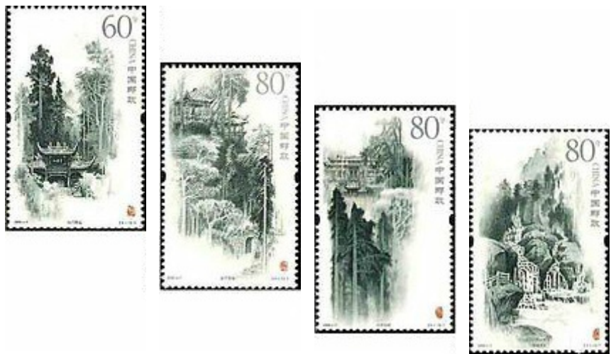
Monti Qingcheng (sacri per i Taoisti)

Il Tao, la Via, è l'essenza prima che costituisce le cose che esistono, è il respiro primordiale che supporta la vita stessa. Il fine è di ricercare l'armonia con la natura per poter raggiungere la completezza e l'unione con l'essenza dell'universo.