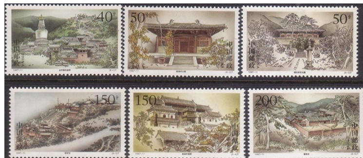
Monte Wutai (Buddismo) – Monte dei Cinque Altopiani o delle Cinque Terrazze dedicato a Manjusri o Buddha Wenshu il 'Principio della Sagghezza di tutti i Buddha – considerato il Bodhisattva della Consapevolezza

Il culto fu introdotto in Cina intorno al I secolo d.C. diramandosi in 'Buddismo del Grande Veicolo' o Mahayana importante per il culto dei Bodhisattva, gli esseri viventi destinati a diventare un Buddha, un Risvegliato; il 'Piccolo Veicolo' o Hinayana, il Buddismo monastico ed il Lamaismo del Tibet e della Mongolia.