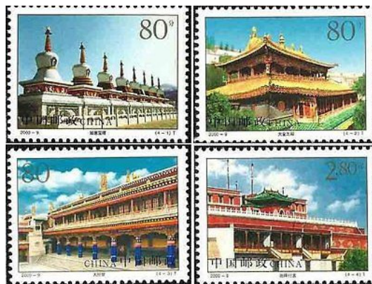
Taer Lamasery ai piedi del Monte Lianhus (Lotus) - Sulla riva del fiume Huangshui – Una delle sei lamaseries costruite dalla Setta Gelugpa seguace del Buddismo Tibetano. E' circondata da otto picchi montuosi che sembrano gli otto petali di un fiore di loto. Le otto pagode ricordano gli otto avvenimenti occorsi a Sakyamuni dal momento della sua nascita al suo raggiungimento del Nirvana.