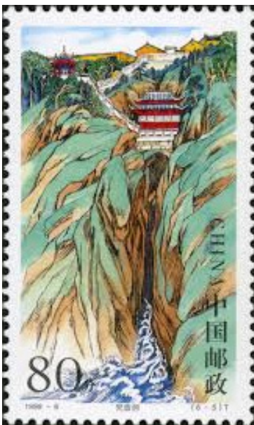
Monte Putuo – consacrato alla dea della misericordia e della compassione Guanyin – oggetto di grande culto poiché si crede che possa guarire corpo e spirito dei sofferenti.- buddismo