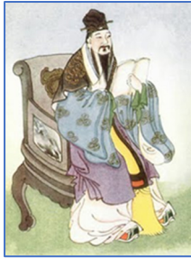
Mencius (372-289 a.C.) – confuciano famoso gran pensatore quasi quanto fu lo stesso Confucio.

L'idea di "Dio" equivale a quello di "Spirito Supremo della Natura" e, nella storia di questa religione non vi sono stati apostoli, martiri, redentori ma soltanto "grandi uomini", "santi" ed "immortali" come tramandato dalle antiche scuole sciamaniche.