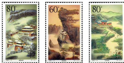
Monti Wudang (sacri per i Taoisti)

Il Tao è l'U<no che si manifesta attraverso la produzione della vita e dell'esistenza; l'uno si scinde in due nella seconda fase e nella terza è simboleggiato dai 3 Puri: il Puro di Giada, il Puro Superiore ed il Grande Puro.