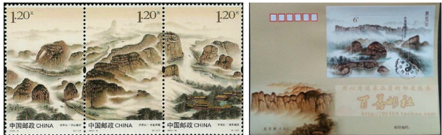
Monti Longhu (sacri per i Taoisti)