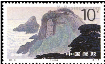
Monte Jiuhua – 'Monte delle nove Bellezze' i cui templi sono dedicati al sovrano dei morti Ksitigarbha protettore degli esseri dei regni infernali - buddismo

Una delle più antiche e più diffuse religioni al mondo è il Buddismo originatasi nell'India nord-orientale tra il VI ed il V secolo a. C. dall'esperienza mistica del personaggio storico Siddhartha Gautama detto Shakyamuni , Saggio della Tribù, il Buddha, 'Colui che si è risvegliato' e va alla ricerca della soluzione del problema dell'eterno morire e rinascere dell'uomo nel ciclo delle sue esistenze.