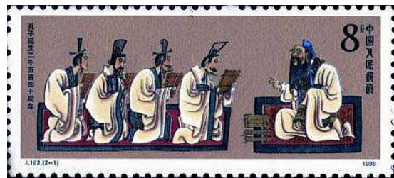
2540° compleanno di Confucio