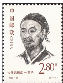
Xunzi (289-238 a.C. ?)