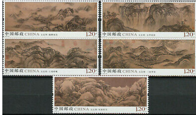
Le Cinque Montagne Sacre

Con la premessa di ben tre religioni base di quella estensione, sono numerosi i Monti Sacri importanti per ognuna di quelle espressioni religiose ad iniziare dalle <Cinque Grandi Montagne>.