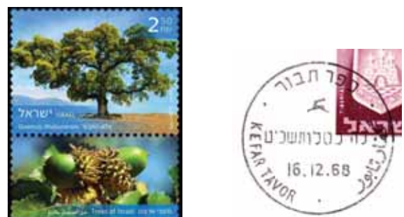
Quercia del Monte Tabor

Come il Monte Carmelo anche il Har Tavor , il Monte Tabor, fu dapprima un luogo di culto cananita al dio Baal che, nel secondo millennio a.C., da lì si estese per le vie commerciali fino a Rodi dove prese il nome di Zeus Atabyrios dal suo luogo di provenienza 'Tabor'.