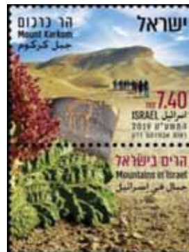
Monte Karkom: il vero "Sinai" ?

In quelle alture si distinguono due monti, entrambi con caratteri sacri, che corrisponderebbero - soprattutto per i tempi di spostamento degli Ebrei nel deserto dopo l'uscita dall'Egitto - alle parole del Deuteronomio cap. 1 <Queste sono le parole che Mosè rivolse a tutto Israele nel territorio al di là del Giordano nel deserto, nella pianura davanti a Suf fra Paran e Tofel ... Undici giorni ci sono da Chorev, attraverso il Monte di Se'ir ... > e questo è, circa, il tempo che occorre per spostarsi, a piedi e tenendo conto della necessità di approvvigionarsi di acqua, e raggiungere quella montagna.