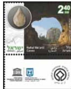
Le Grotte di Nahal Me'arot si aprono sul versante occidentale del Monte Carmelo; l'archeologia ha dimostrato ( con l'amigdala nel cerchio in alto a sx) che erano abitate fin da cinquecentomila anni fa.

L' Har ha-Karmell , il Monte Carmelo, la "Vigna di D.o" in Alta Galilea, è stato il luogo dove il profeta Elia ha sfidato i falsi profeti di Bà'al; egli chiede che si mandino <... a radunare presso di me al monte Carmel tutto Israele e i quattrocentocinquanta profeti del Bà'al e i quattrocento profeti dell'Ascerà (Astarte) che mangiano alla tavola di Izéve> (1 Re 18:19 e seg.) In effetti, il Baal del Carmelo fu venerato su questa altura come il dio della regione fin dai tempi dei Cananei poi David inglobò il territorio nel suo regno intorno all'anno 1000 a.C. ma fu soltanto all'epoca di Elia (IX sec. a.C.) che il culto fu debellato ma ebbe vita breve in quanto con la conquista assira del 732 a.C. gli indigeni tornarono ad adorare Baal poi, in epoca greca fu sostituito dal culto a Giove e, in seguito, i Romani lo dedicarono al Deus Carmelus una derivazione dello Zeus di Heliopolis. (Per saperne di più vedi articolo sul n. 110 del 2011: "Il tuo capo ti sovrasta come il Carmelo")