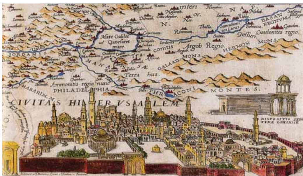
Gerard de Jode (1509-1591) Descrizione della Terra Santa nel 1578

Dalla Terrasanta ci sposteremo, in seguito, dove ci porteranno (possibilmente) gli articoli dei nostri soci volenterosi.