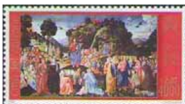
Sermone della Montagna

Il santuario fu distrutto dagli Asmonei nel 128 a.C. ed i Samaritani furono perseguitati prima da Ponzio Pilato poi da Vespasiano, il cui Legatus Legionis che ne uccise undicimilaseicento e dagli imperatori romani e bizantini e tuttavia essi sono sopravvissuti fino ai nostri giorni continuando a credere soltanto ai cinque Libri di Mosè ed a Monte e vi sacrificano sette agnelli, secondo le istruzioni ricevute e poi impartite dall'Arciprofeeta alla vigilia dell'Uscita dall'Egitto (Es. 12).