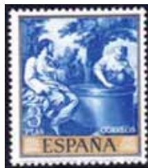
Gesù e la Samaritana

I Samaritani, una popolazione costituita da Ebrei non deportati dopo la caduta del Regno d'Israele nel 721 a.C. sposati con gente di Babilonia e Cuthah colà trasferiti forzatamente, vi costruirono nel 350 a.C. un Santuario, ad imitazione di quello di Gerusalemme, che il seleucida Antioco IV nel 168 a.C. ridedicò a Giove nel suo programma di ellenizzazione dei suoi possedimenti.