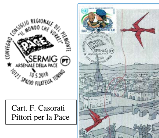
Cart. F. Casorati Pittori per la Pace

Università del Dialogo: La "Università del Dialogo che nasce dal dubbio". Attiva dal 2004, l'Università organizza cicli di incontri e corsi per condividere il sapere e metterlo a servizio di tutti; per capire ed accettare la diversità, con la volontà di sedersi attorno ad un tavolo disposti a non arroccarsi su posizioni precostituite; per stimolare giovani e adulti ad interrogarsi sui grandi temi dell'esistenza: la giustizia, la pace, la solidarietà, la fede, i diritti umani, la famiglia, il rispetto della natura, le sfide della bioingegneria, il lavoro, l'economia, il pensiero filosofico ed etico. L'Università del Dialogo ha come maestri donne e uomini