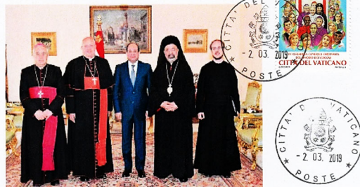
Card. Leonardo Sandri inviato del Papa alle Celebrazioni in Egitto per VIII centenario dell'incontro tra San Francesco d'Assisi e il sultano al-Malik al Kamel.