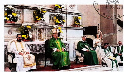
Card. Leonardo Sandri inviato del Papa alle Celebrazioni in Egitto per VIII centenario dell'incontro tra San Francesco d'Assisi e il sultano al-Malik al Kamel.