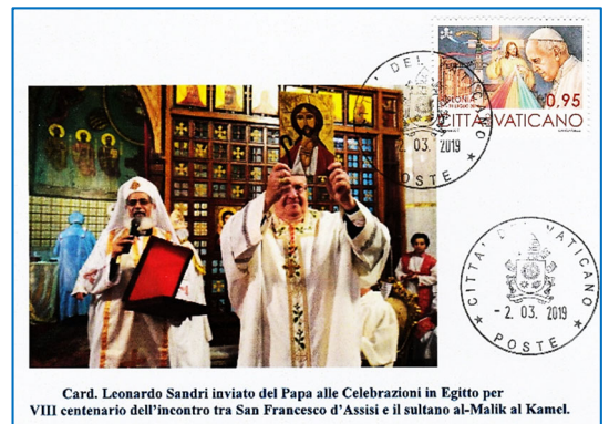
Card. Leonardo Sandri inviato del Papa alle Celebrazioni in Egitto per VIII centenario dell'incontro tra San Francesco d'Assisi e il sultano al-Malik al Kamel.