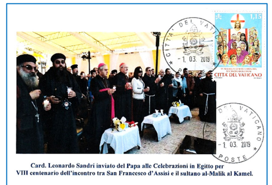
Card. Leonardo Sandri inviato del Papa alle Celebrazioni in Egitto per VIII centenario dell'incontro tra San Francesco d'Assisi e il sultano al-Malik al Kamel.