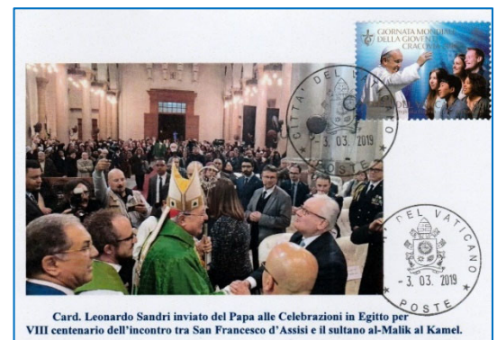
Card. Leonardo Sandri inviato del Papa alle Celebrazioni in Egitto per VIII centenario dell'incontro tra San Francesco d'Assisi e il sultano al-Malik al Kamel.