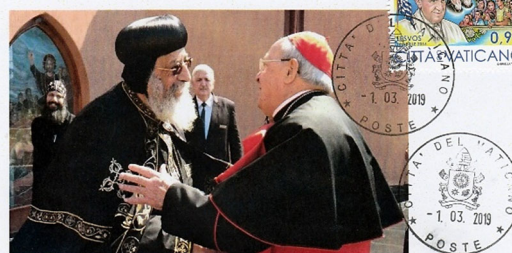
Card. Leonardo Sandri inviato del Papa alle Celebrazioni in Egitto per VIII centenario dell'incontro tra San Francesco d'Assisi e il sultano al-Malik al Kamel.