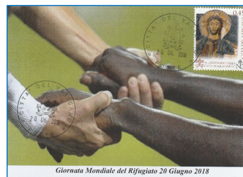
Giornata Mondiale del Rifugiato 20 Giugno 2018