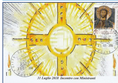
31 Luglio 2018 Incontro con Ministranti