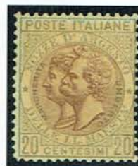
(non emesso) per il 25° anniversario delle nozze reali

Alla Vigilia di Natale 1899 il Papa aprì la Porta Santa con un martello d’oro fabbricato a spese di tutti i Vescovi e subito un grande afflusso di pellegrini arrivò da tutto il mondo comprese le Americhe, gente comune – forse quattrocentomila pellegrini - e personaggi celebri tra cui il re e la regina d’Italia,