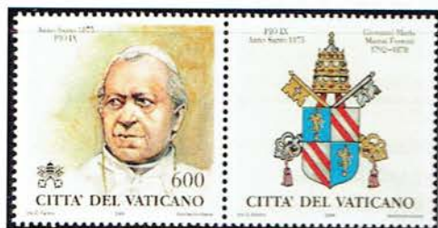
1875 – un Anno Santo che non poté essere celebrato

Comunque non era il tempo di pensare ad un Anno Santo anche se il potere temporale della Chiesa era stato ristabilito.