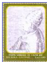
Papa Urbano VI