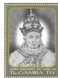
Papa Gregorio XII